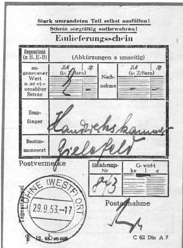
Bild links: Einlieferungsschein für Einschreiben, Postannahme Löhne (Westf.) Ort vom 29.9.1953