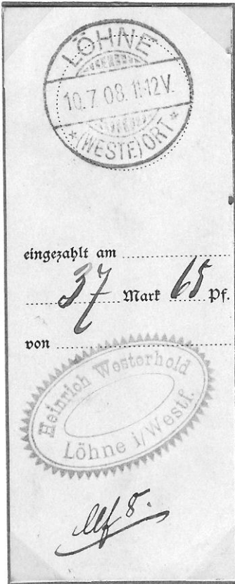
Bild links: Einlieferungsschein für eine Geldüberweisung. Postannahme Löhne* (WESTF.)Ort*, vom 10.7.1908.