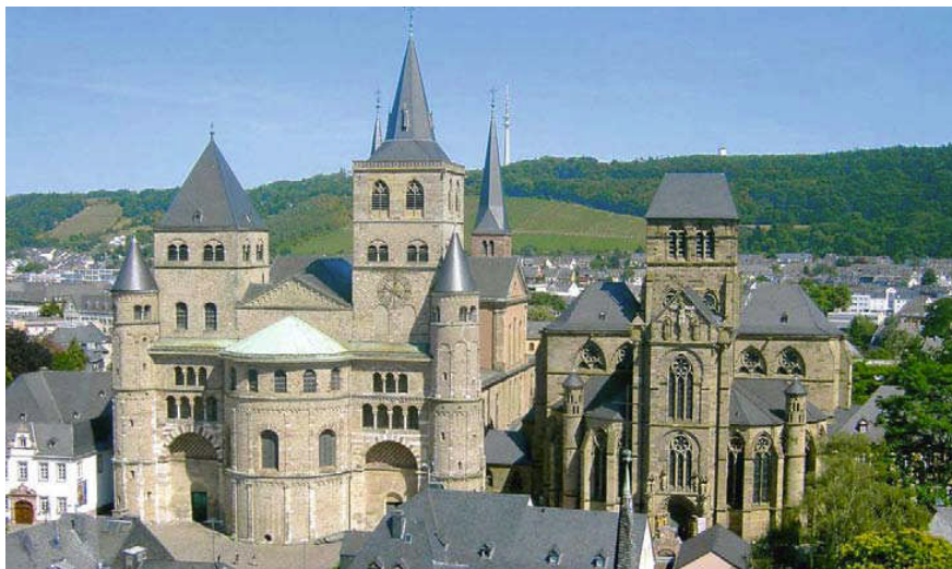
Dom und Liebfrauenkirche