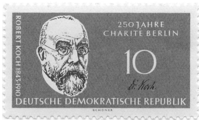
DDR MiNr. 796 , 150 Jahre Humboldt Universität Berlin