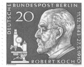
Berlin MiNr. 191 , zum 50. Todestag